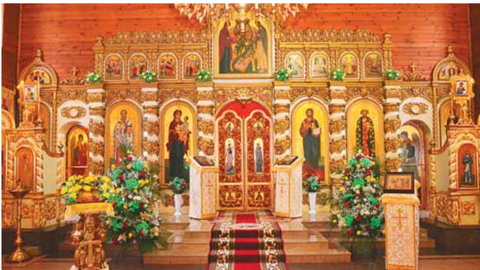
Внутреннее убранство храма