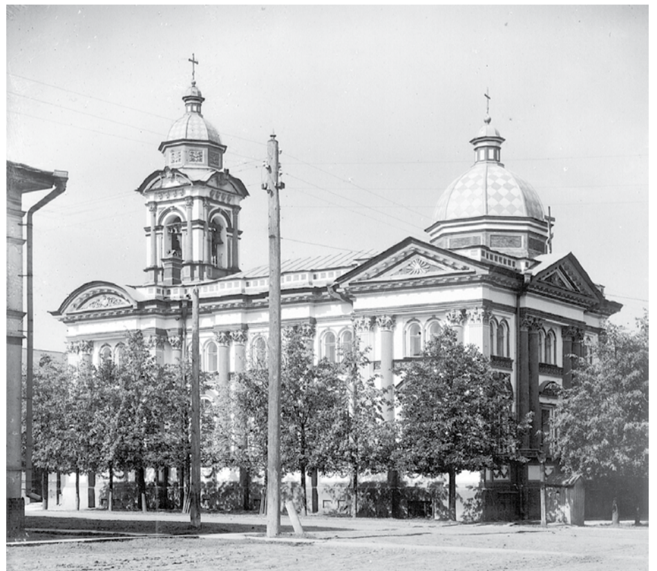
Храм равноапостольной Марии Магдалины. Начало XX в.