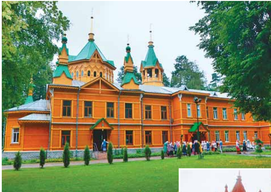
Современный вид Княже-Владимирского храма