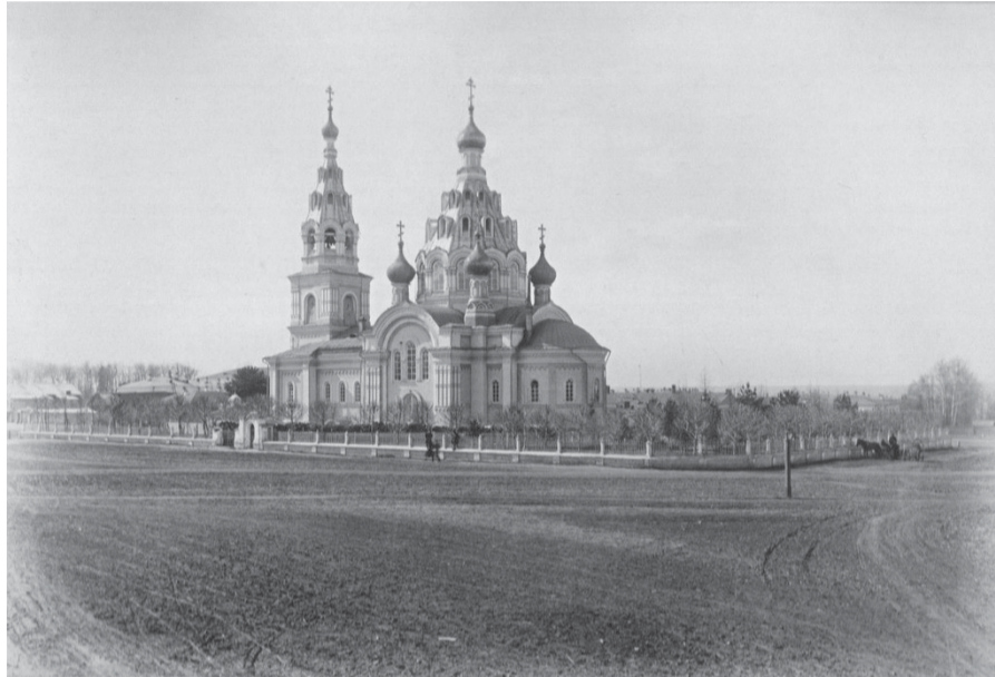
Собор Воскресения Христова. Вид храма до разрушения

В сентябре 1918 г. в правом приделе церкви по желанию приходского совета был сооружен престол, освященный в