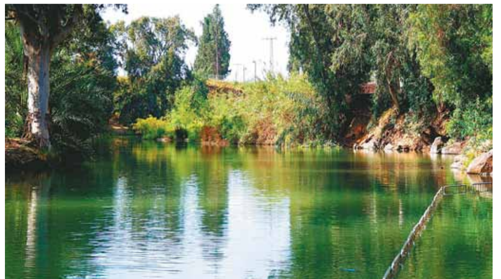
Иордан в наши дни