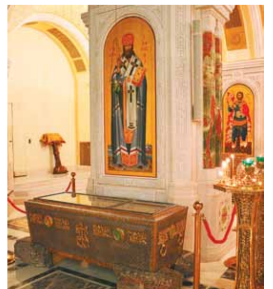
Рака с мощами священномученика Илариона, архиепископа Верейского