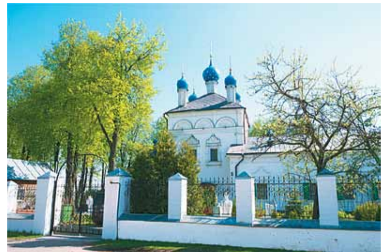
Храм Рождества Пресвятой Богородицы в селе Верхнее Мячково