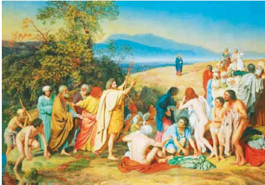
«Явление Христа народу». Александр Иванов (1837–1857 гг.)

Путь начинался из Иерусалима, проходил мимо Елеон-