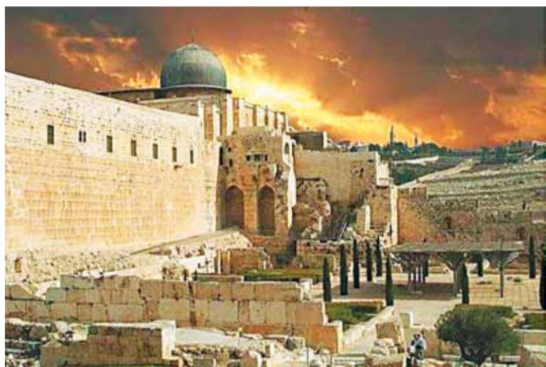
Храм Единого Бога в Иерусалиме

Поклонение святым мощам связано с присутствием им Божественным даром чудотворения. Священное Писание и опыт Христовой Церкви свидетельствуют, что физическая материя может содержать в себе особенный вид духовной энергии, называемой в христиан-