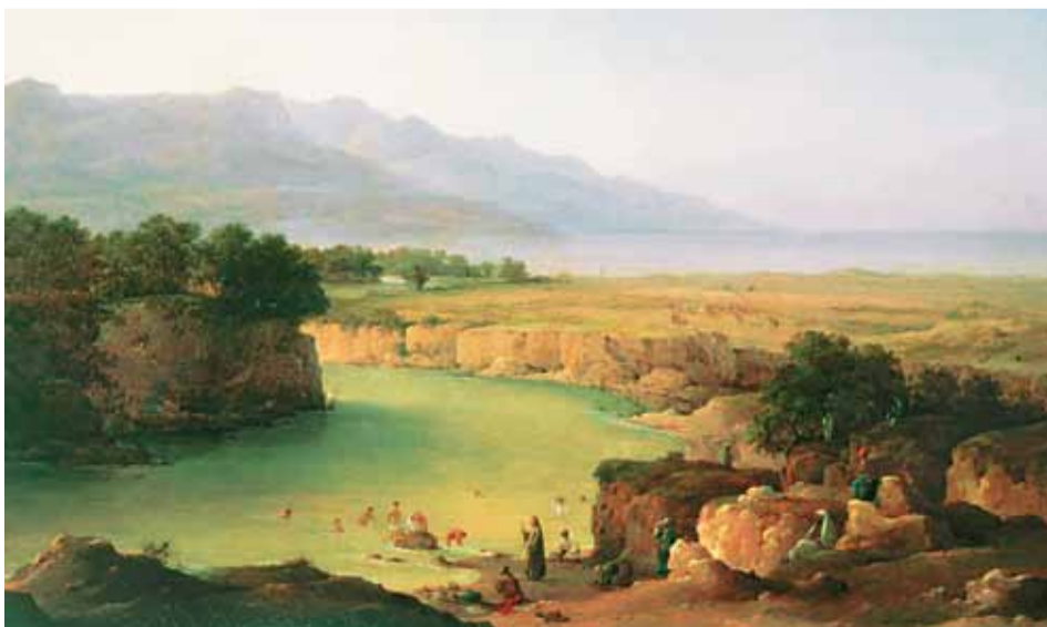
Иордан. Библейские времена

Границу, надо сказать, не всегда мирную, в связи с чем подходы к реке как с одной, так и с другой стороны находятся под пристальным наблюдением военных.